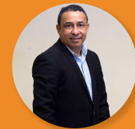
Ever Martínez Tecnología Agroambiental Norte