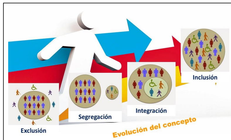
Figura 2. Evolución del concepto de educación inclusiva en el contexto colombiano.

Desde este postulado, son diversos los escenarios de participación que se generan en el desarrollo de una postura institucional frente al tema de inclusión habiendo pasado por varios escenarios de análisis, desde la exclusión por razones de diferencia (física, étnica o social), hasta la inclusión, donde se respeten las diferencias en todas las dimensiones y formas de pensamiento: