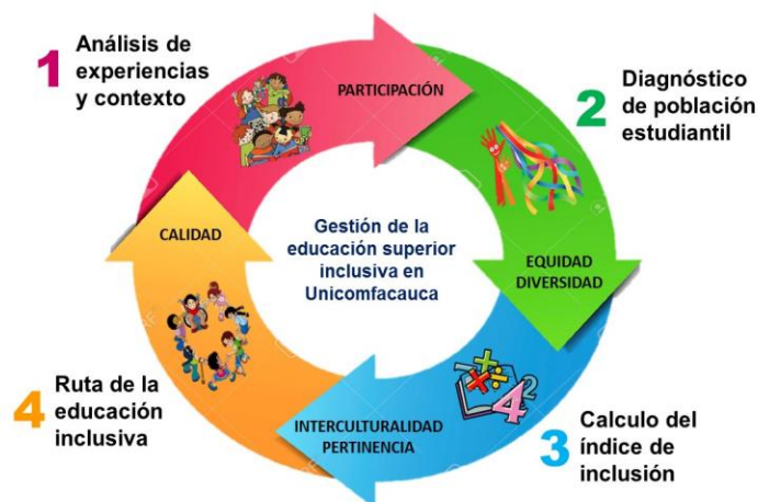
Figura 5. Metodología para el desarrollo de la ruta de educación inclusiva en UnicomfacaUCA.

De conformidad con los postulados y reflexiones expuestas en el presente documento marco de referencia para la gestión de la educación superior inclusiva en UnicomfacaUCA, se presenta la metodología a implementar, con el propósito de establecer las acciones a implementar en la búsqueda de consolidar una ruta de educación inclusiva acorde con el contexto de la población estudiantil.