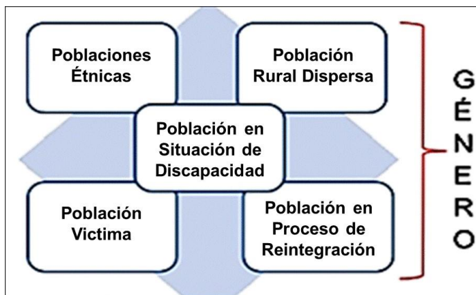
Figura 1. Grupos de interés con enfoque de género: El caso colombiano.